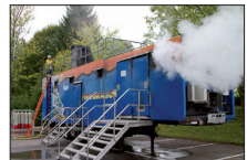
der Fire Dragon am Atemschutztraining