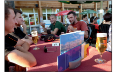
nach der äusserst anstrengenden Wanderung an der Atemschutzreise