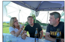
am Familienfest, was isch denn au da los?