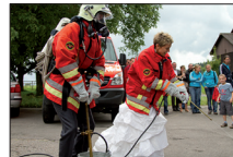
auch jetzt schon ein gutes Team...