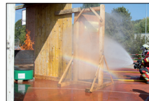
Strahlrohrtraining am Atemschutztraining